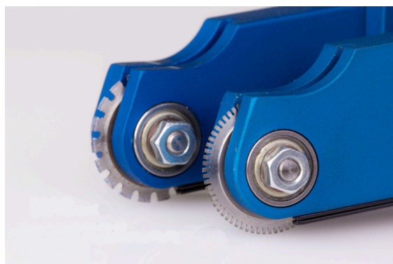
Perforovací kolečko 9 TPI

Řezací kolečko - lze nastavit úplné rozříznutí archu nebo jen jako nářez do částečné hloubky známý jako kiss-cutting, slouží pro nařezání samolepek.